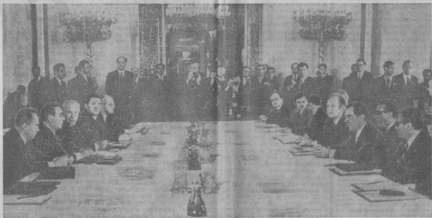
Москва, 23 мая. Советско-американские переговоры в Кремле.

СССР А. А. Громыко, заместитель министра иностранных дел СССР В. В. Кузнецов, посол СССР в США А. Ф. Добрынин, помощник Генерального секретаря ЦК КПСС А. М. Александров и член коллегии Министерства иностранных дел СССР Г. М. Корниенко. С американской стороны — государственный секретарь США У. Роджерс, помощник Президента по вопросам национальной безопасности Г. Киссинджер, посол США в СССР Дж. Бим, помощник Президента по внешнеэкономическим вопросам П. Флэнган, заместитель государственного секретаря М. Хилленбранд, заведующий отделом госдепартамента США Д. Мэтлок, пресс-секретарь Белого дома Р. Зиглер и сотрудники аппарата Белого дома Х. Сонненфелд и У. Хайленд.