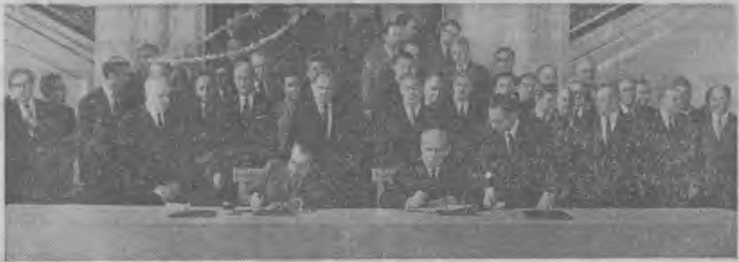
Москва, 23 мая. Председатель Президиума Верховного Совета СССР Н. В. ПОДГОРНЫЙ и Президент США РИЧАРД М. НИКСОН, находящийся в Советском Союзе с официальным визитом, подписали Соглашение о сотрудничестве в области охраны окружающей среды, заключенное между Советским Союзом и США.

вопросы развития торгово-экономических отношений между СССР и США. В беседе участвовали заместители министра внешней торговли СССР В. С. Алхимов и А. Н. Манжуло. (ТАСС).